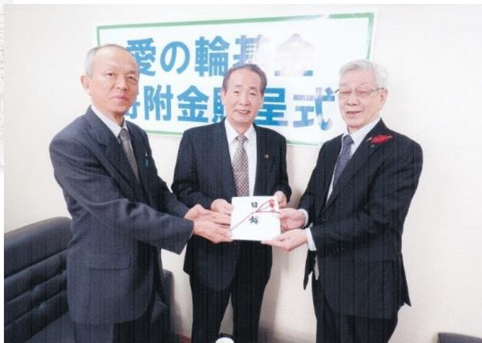
左より三沢つばさ会会長、OB会会長、社協会長